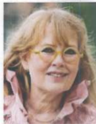
Marie-Louise Ekman.

Senare har jag ju insett hur Marie-Louise Ekman, som hon heter i dag, inte bara dekapiterar utan också bejaktar kvinnlighetens attribut. Det finns ett stort mått av njutning i den rosa flickkrumsetetik hon etablerar i svensk konst, som också bekräftar den ikonografiska gilligheten hos feminin trivialia. Hur hon lyckas förvandla den till angelägna existentiella kategorier. En munter performativitet genomsyrar konstnärskapet, ett lustfyllt spel med masker och roller. Och en vederkvickande